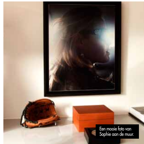
Een mooie foto van Sophie aan de muur.