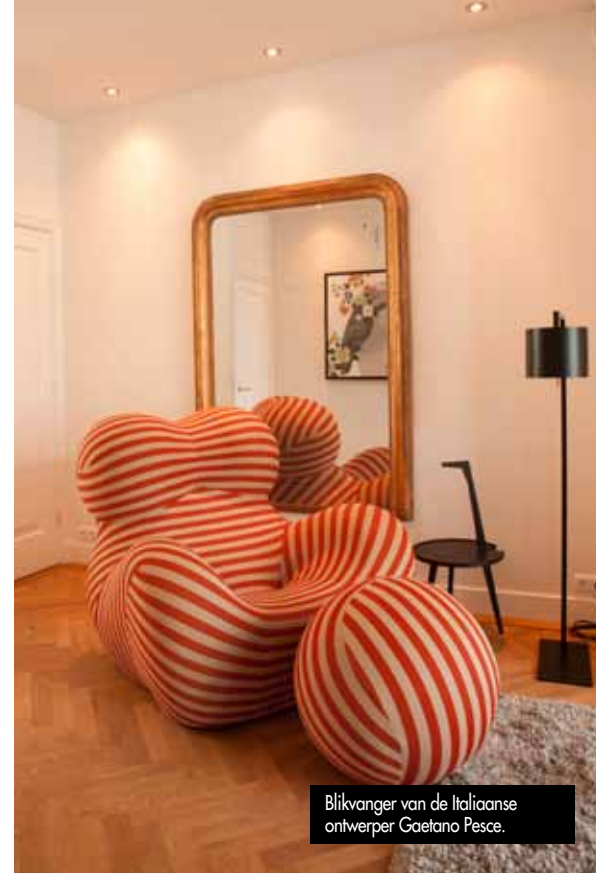
Blikvanger van de Italiaanse ontwerper Gaetano Pesce.