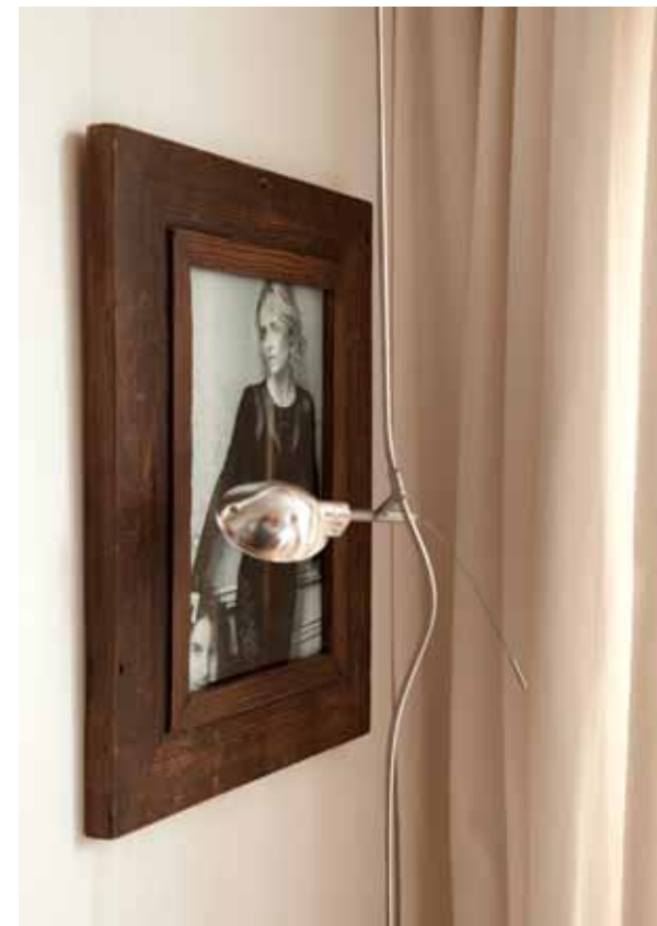
Het trouwalbum van Xander en Sophie.