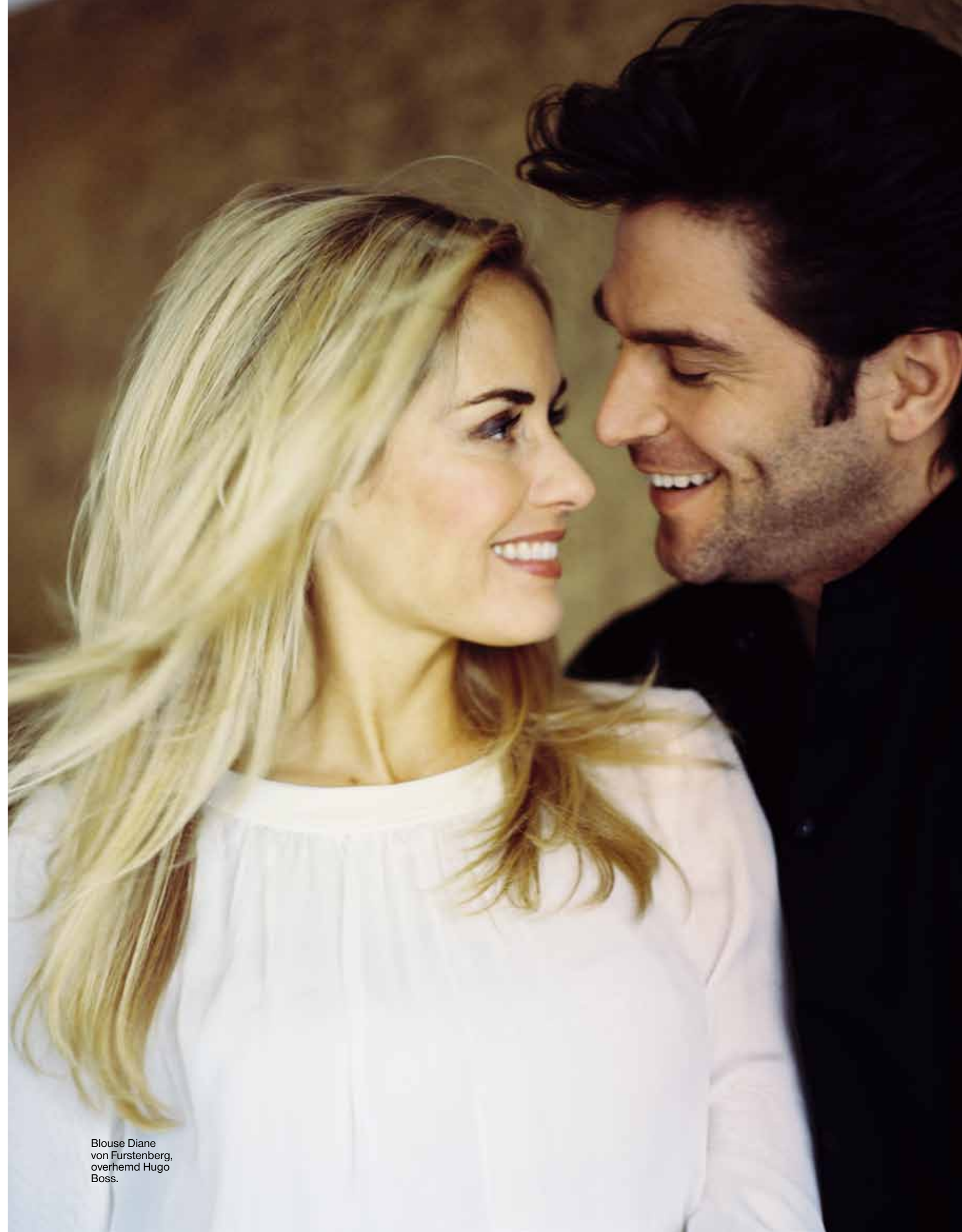
Blouse Diane von Furstenberg, overhemd Hugo Boss.

X: 'Als we samen in bed liggen met de jongens tussen ons in, denk ik: dit is geluk.' ■